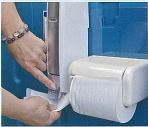
▲除菌シート(便座除菌用)