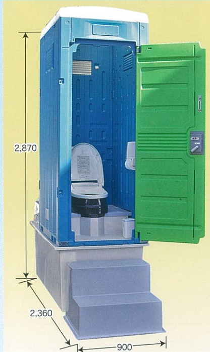
幅900 × 奥行き1,800 × 高さ2,870mm (階段を含める奥行き2,360mm) 動力/100V電源(70W)